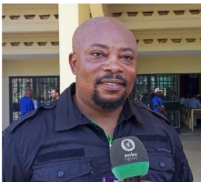
Adams Cassinga, Conser Congo